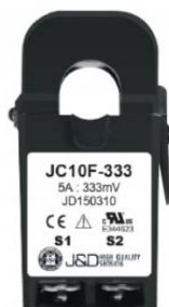
Obrázek 1 Proudový transformát 5A /330 mV

Výhodou tohoto přístupu je, že není potřeba přivádět proudový okruh až k přístroji, ale stačí, pokud je dostupný v rámci rozvodny. V daném místě je pak nasazen proudový transformátor XX A/ 330mV a odtud je již vedeno jen nízké napětí.